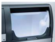
Higieniczny uchwyt na łopatkę