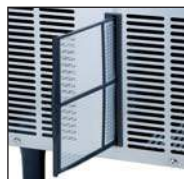
Filtr powietrza w panelu przednim