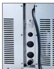
Panel przyłączy we wgłębieniu