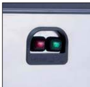
Włącznik główny ON-OFF