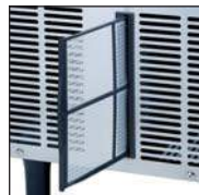
Filtr powietrza w panelu przednim