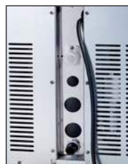
Panel przyłącza we wgłębieniu