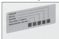
Stal nierdzewna SS AISI 304